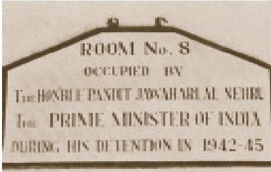
अहमदनगर किले का वह कक्ष जहाँ 1942-45 में जवाहरलाल नेहरू को रखा गया