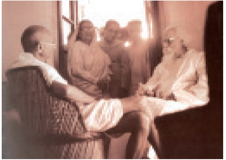
गांधी और टैगोर

बीसवीं शताब्दी के पूर्वार्द्ध में टैगोर और गांधी निस्संदेह भारत के दो विशिष्ट और प्रभावशाली व्यक्तित्व थे। उनकी समानताओं और विषमताओं की तुलना से हम बहुत कुछ सीख सकते हैं। कोई दो व्यक्ति अपनी बनावट और मिजाज में एक-दूसरे से इतने भिन्न नहीं हो सकते। टैगोर संभ्रांत कलाकार थे, जो सर्वहारा के प्रति सहानुभूति के कारण लोकतंत्रवादी हो गए थे। गांधी, जो विशेष रूप से जनता के आदमी थे, भारतीय किसान का साकार