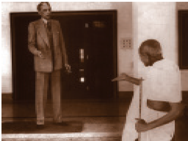
जिन्ना और गांधी

जिसे सांप्रदायिक समस्या कहा जाता था, वह अल्पसंख्यकों के अधिकारों के साथ इस तरह तालमेल बैठाना था ताकि उन्हें बहुसंख्यकों के खिलाफ़ पर्याप्त संरक्षण मिल सके। भारत के अल्पसंख्यक यूरोप की तरह जातीय या राष्ट्रीय अल्पसंख्यक नहीं, वे धार्मिक अल्पसंख्यक हैं। जातीय दृष्टि से भारत में एक विचित्र मिश्रण है, पर जातीय सवाल भारत में न कभी उठे हैं न उठ सकते हैं। धर्म इन जातीय विभिन्नताओं के ऊपर है। जातियाँ या तो एक दूसरे में मिल जाती हैं या उनमें अंतर करना कठिन होता है। ज़ाहिर है कि धार्मिक दीवारें स्थायी नहीं होतीं और जो व्यक्ति अपना धर्म बदलता है उसकी जातीय पृष्ठभूमि या उसकी जातीय और भाषिक विरासत नष्ट नहीं हो जाती। परंतु राजनीतिक मामलों में, धर्म का स्थान सांप्रदायिकता ने ले लिया है। यह एक संकीर्ण समुदाय